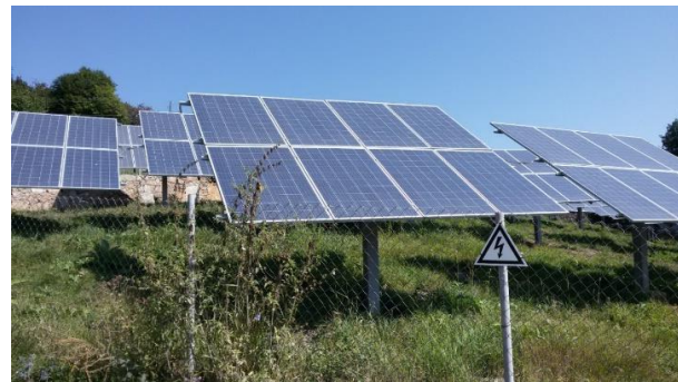
Նկ. 4. Ենոքավանի 150 կՎտ ՖՎ կայան