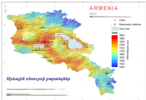
Նկ. 1. Հայաստանի արևային ռեսուրսների քարտեզ (www. R2e2.am)

Հետազոտության ընթացքում հեղինակը երկու անգամ այցելել է «Սոլարոն» ՍՊԸ-ի գրասենյակը Երևանում: Ինձ ցույց տվեցին Solaron LLC արևային վահանակների արտադրական տեղամասը: Պանելների արտադրության հզորությունը կազմում է 50ՄՎտ/տարի: Հարցաշար է մշակվել է ՖՎ կայանի վերաբերյալ տվյալներ հավաքելու համար: Կայանի աշխատանքի վերաբերյալ տվյալները տրամադրել է Սոլարոն ՍՊԸ: Հավաքագրված տվյալները բերված են Աղյուսակներում 1-3: